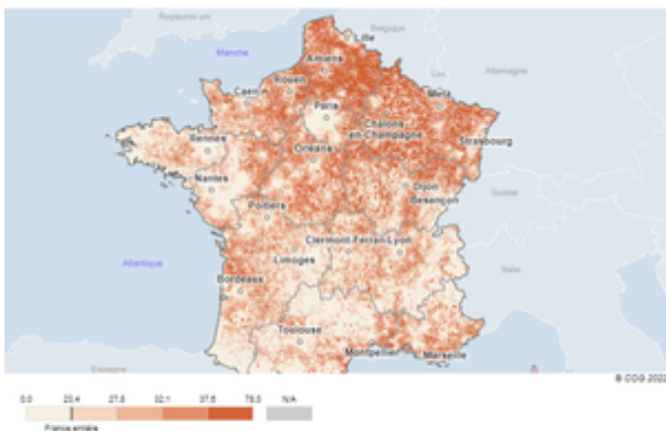
Figure 4 : Vote Le Pen par commune ( % des suffrages exprimés). Ministère de l'Intérieur, Observatoire des votes en France

Dans ce cas, relégation spatiale et relégation sociale se combineraient pour produire un vote RN fort.