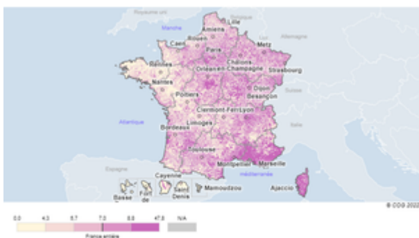
Figure 2 : Vote Zemmour par commune ( % des suffrages exprimés). Ministère de l'Intérieur, Observatoire des votes en France

Ce gradient ouest-est est ensuite complété par des zones de force régionales typiques du FN historique : le pourtour méditerranéen, la région lyonnaise, l'Île-de-France et à un niveau moindre la Lorraine, l'Alsace et la Bourgogne.