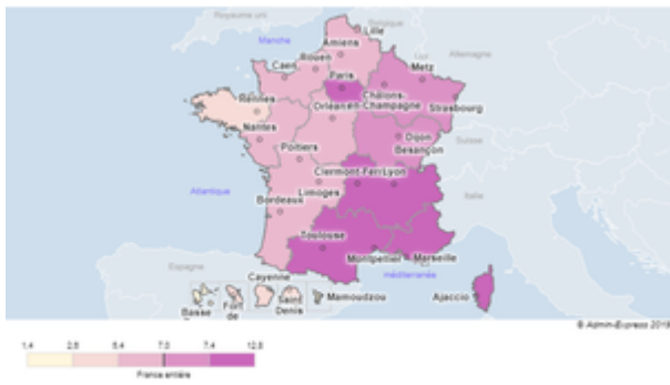
Figure 1 : Vote Zemmour par région ( % des suffrages exprimés). Ministère de l'Intérieur, Observatoire des votes en France

Ce gradient ouest-est est ensuite complété par des zones de force régionales typiques du FN historique : le pourtour méditerranéen, la région lyonnaise, l'Île-de-France et à un niveau moindre la Lorraine, l'Alsace et la Bourgogne.