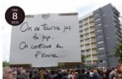
Illustration tirée de Cerises-La Coopérative

Le sujet des retraites illustre comment lier défense des revendications immédiates et alternatives au système capitaliste. L'immédiat, c'est le refus de la contre-réforme. Il est juste de dénoncer le recul de l'âge légal de départ en retraite, de refuser l'accroissement du nombre d'annuités pour avoir une retraite à taux plein, d'expliquer le scandale des « 25 meilleures années » appliquées au régime général qui entraîne des pensions beaucoup plus faibles qu'elles ne le sauraient si la base était par exemple « les 6 meilleurs mois », de revendiquer une vraie prise en compte des pénibilités, de réclamer des mesures instituant l'égalité entre les femmes et les hommes, etc.