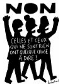
Illustration tirée de Cerises-La Coopérative