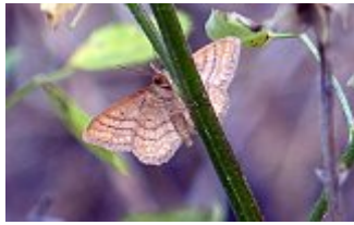
L'acidalie ocreuse, Idaea ochrata, parc des Beaumonts, 25 juin 2015.