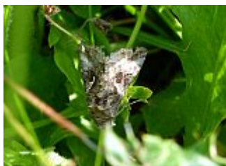
Le gamma, Autographa gamma, parc des Beaumonts, 11 juin 2021.