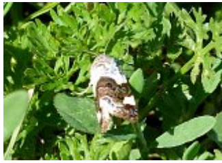
Le Collier argenté, Acontia lucida, parc des Beaumonts, 25 août 2019 (année chaude).