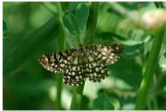
La géomètre à barreaux, Chiasmia clathrata, 6 mai 2011