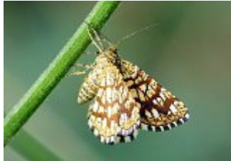
La géomètre à barreaux, Chiasmia clathrata, parc des Beaumonts, 03 août 2019. Cliché Pierre Rousset.