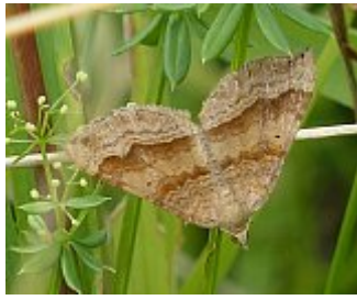
La phalène de l'ansérine, Scotopteryx chenopodiata, parc des Beaumonts, 07 août 2013.