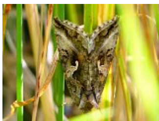
Le gamma, Autographa gamma, parc des Beaumonts, 20 juin 2018.