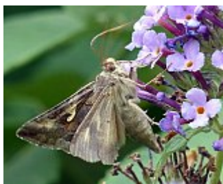
Le gamma, Autographa gamma, parc des Beaumonts, 22 juillet 2015.

L'espèce peut être confondue avec d'autres espèces de noctuelles, notamment la Goutte d'argent ( Macdunnoughia confusa (Stephens, 1850)). La forme de la tache blanche chez ces espèces est différente [1].