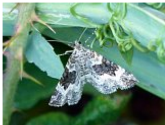
L'alternée, Epirrhoe alternata, parc des Beaumonts, 22 août 2016.

Habitat : galium, milieux herbus, végétation basse de lisière