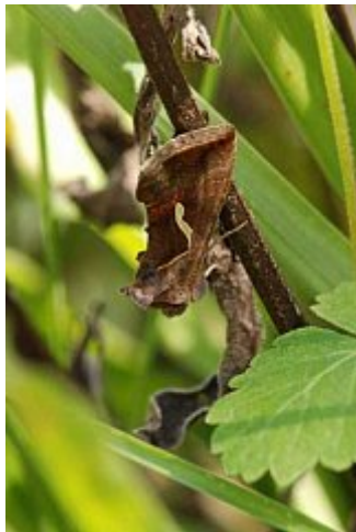
La confuse, Macdunnoughia confusa, parc des Beaumonts, 31 août 2011