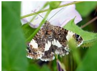
La funèbre, Tyta luctuosa, parc des Beaumonts, 20 juin 2021.