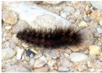
Chenille d'Arctiinae spe, parc des Beaumonts, 18 mars 2013.