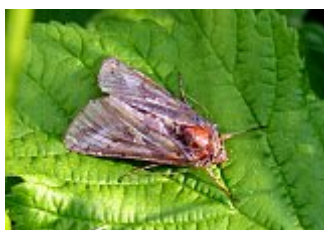
Le gamma, Autographa gamma, parc des Beaumonts, 15 juin 2021.