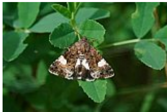
La funèbre, Tyta luctuosa, 9 août 2010.

Habitat : pelouses, liserons, grand plantain