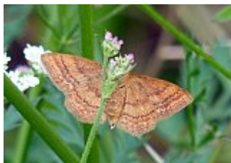
L'acidalie ocreuse, Idaea ochrata, parc des Beaumonts, 11 juillet 2021.