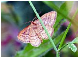
L'acidalie ocreuse, Idaea ochrata, parc des Beaumonts, 09 juillet 2021.