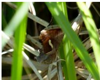
La confuse, Macdunnoughia confusa, parc des Beaumonts, 11 mai 2018, cliché Pierre Rousset