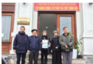
Vietnamese Intellectuals Denounce Police Killing at Dong Tam

« Je pense que le peuple vietnamien doit faire part de ses inquiétudes à propos de Đông Tâm, et exiger des informations transparentes du gouvernement ». Il a ajouté que « le gouvernement doit coopérer avec une enquête indépendante sous la surveillance de la presse, des organisations sociales et des citoyens vietnamiens ». « Nous savons que le combat pour la justice pour Dong Tam sera long et long, mais nous sommes déterminés à le mener à bien », a-t-il conclu.