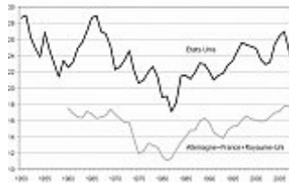
Graphique 1: Le taux de profit aux Etats-Unis et en Europe

A cette position « haussière » s’oppose une analyse « baissière » (pour employer les termes les plus neutres possibles, empruntés ici au langage boursier) qui conteste ce schéma et avance d’autres évaluations du taux de profit, qui ne font pas apparaître de tendance à la hausse depuis le début des années 1980. L’éventail est d’ailleurs assez large, puisqu’il va d’une augmentation moins nette à la baisse tendancielle, en passant par l’encéphalogramme plat.